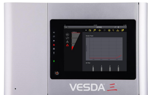
7" Touch screen (optie) in ontwikkeling