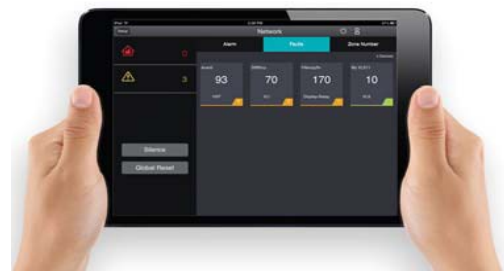
Via WiFi iVESDA op tablet of iPad